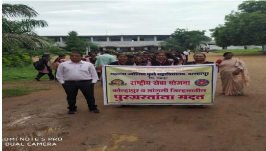
Programs taken in the College by the Department of History

महाराष्ट्राची उत्कृष्ट प्रमाणे केले. यावेळी आचार्यांच्या अध्यक्षतेखाली एक बैठक झाली. यावेळी आचार्यांनी विद्यार्थ्यांना या संधीत उत्सव साजरा करण्याचे आदेश दिले. यावेळी आचार्यांनी विद्यार्थ्यांना या संधीत उत्सव साजरा करण्याचे आदेश दिले.